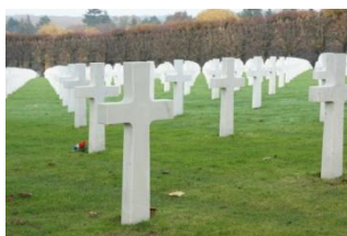
Stèles du cimetière américain de ROMAGNE

Pour finir, nous irons à la découverte d'un type de guerre particulier, la « guerre des mines » avec la butte de VAUQUOIS. La visite se passe en extérieur où sont visibles des restants de tranchées et des cratères. Le circuit passe sur les côtés français et allemand.