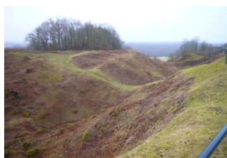
Cratères de mines