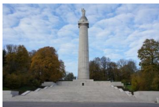
Tour de MONTFAUCON

Nous verrons l'intervention officielle des Etats-Unis en 1917 : nous visiterons la Tour de MONTFAUCON, monument symbole des combats MEUSE-ARGONNE et le cimetière de ROMAGNE-SOUS-MONTFAUCON.