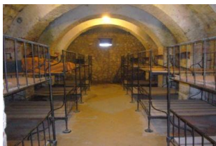
Découverte du monument emblématique du champ de bataille Ossuaire de DOUAUMONT

Ensuite, vous visiterez l'intérieur et l'extérieur du fort de DOUAUMONT