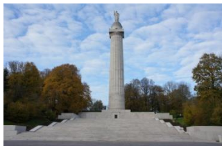
Tour de MONTFAUCON

Nous verrons l'intervention officielle des Etats-Unis en 1917 : nous visiterons la Tour de MONTFAUCON, monument symbole des combats MEUSE-ARGONNE et le cimetière de ROMAGNE-SOUS-MONTFAUCON.