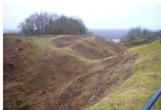
Cratères de mines