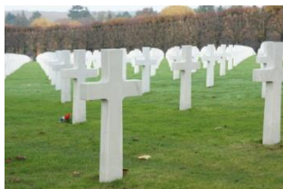
Stèles du cimetière américain de ROMAGNE

Pour finir, nous irons à la découverte d'un type de guerre particulier, la « guerre des mines » avec la butte de VAUQUOIS. La visite se passe en extérieur où sont visibles des restants de tranchées et des cratères. Le circuit passe sur les côtés français et allemand.