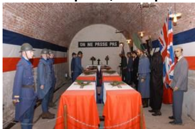
Cérémonies du choix du soldat inconnu

Vous visiterez pour finir votre circuit, la citadelle souterraine de VERDUN, en wagonnets et à pieds, dans près de 700 mètres de galeries.