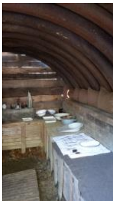
Poste de secours reconstitué

L'après-midi sera consacrée à la bataille de VERDUN sur la Rive Gauche de la zone de combat. Nous ferons un arrêt à la tranchée reconstituée de CHATTANCOURT avec son petit musée : un groupe de passionnés ont réalisé une tranchée et exposent des objets. Un mur de « Mémoire » fut réalisé.