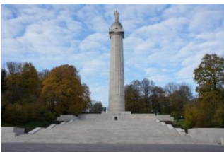
Tour de MONTFAUCON

Nous verrons l'intervention officielle des Etats-Unis en 1917 : nous visiterons la Tour de MONTFAUCON, monument symbole des combats MEUSE-ARGONNE et le cimetière de ROMAGNE-SOUS-MONTFAUCON.